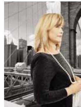
I samarbete med Jazz i Tällberg

Fredag 8 juli 20.30 Kultursalongen Klockargården, Tällberg